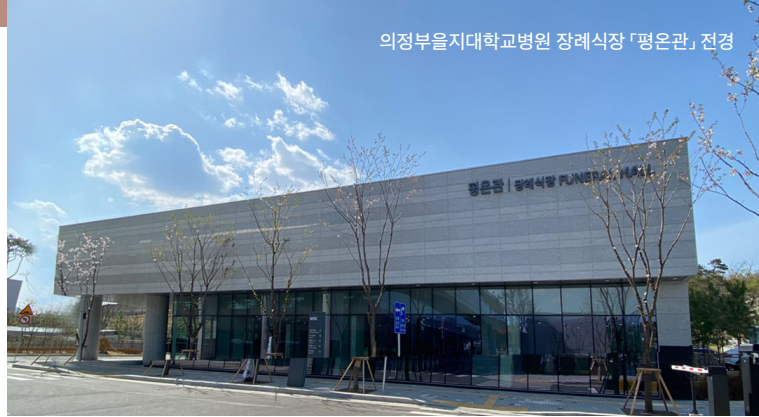
의정부을지대학교병원 장례식장 '평온관' 전경